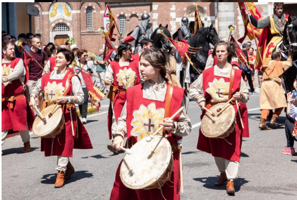
Dolcetto o scherzetto?...